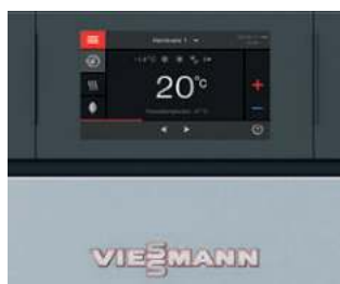
Vitotronic 200 - встроенный контроллер для модулей отопительных котлов

Vitocrossal 200 идеально подходит для установки в котельных многоквартирных домов и на промышленных предприятиях. Каскадная установка может состоять максимум из 8 котлов. Для установок из двух котлов компания Viessmann предоставляет готовые к монтажу системные трубные обвязки и выпускные коллекторы из высококачественной нержавеющей стали. Отопительная установка оснащена надежными компонентами газового конденсационного оборудования компании Viessmann, такими как теплообменные поверхности Inox-Crossal и цилиндрические горелки MatriX или ИК-горелки MatriX. Отопительный котел может эксплуатироваться с выбором режима работы: возможна работа с забором воздуха для горения из помещения котельной, а также извне.