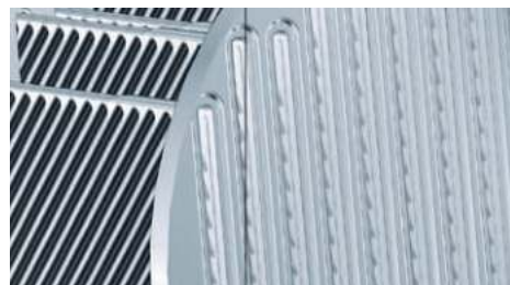
Теплообменная поверхность Inox-Crossal для обеспечения высокоэффективной теплопередачи и высокой скорости процесса конденсации.

Высокая эффективность теплопередачи и высокая скорость конденсации обеспечивают КПД до 98 процентов ( \eta_s ). Эти значения достигаются за счет противотока продуктов сгорания и котловой воды, а также интенсивного закручивания нагревательных газов через поверхность нагрева.