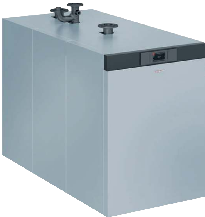
Vitocrossal 200 – Газовый конденсационный котел с номинальной тепловой мощностью от 87 до 311 кВт

Газовый конденсационный котел Vitocrossal 200 (тип CM2C) мощностью от 87 до 311 кВт задает новые масштабы в модульном исполнении. Благодаря применению хорошо зарекомендовавшей себя цилиндрической горелки MatriX становится возможной эксплуатация на газе типа E, L, LL, при мощности от 186 кВт – также и на сжиженном, а кроме того, модуляция до 20 %.