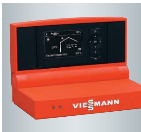
Устройство управления Vitotronic 200 с графическим дисплеем