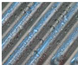
Inox-Crossal-поверхность из нержавеющей стали

Газовые конденсационные котлы - самое эффективное газовое оборудование для отопления и горячего водоснабжения.