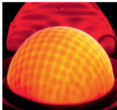
Вежа в развитии отопительной техники: газовая инфракрасная горелка MatriX с низкой эмиссией вредных веществ

Газовая горелка MatriX с интегрированной функцией Lambda Pro Control позволяет автоматически адаптироваться под любой тип газового топлива и изменяемый коэффициент избытка воздуха. Благодаря этому достигается постоянно высокий коэффициент полезного действия до 98 процентов, как при работе на природном, так и на сжиженном газе.